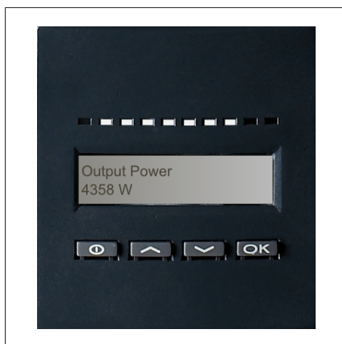
Ilustração 2.2: Display

Através do display integrado na frente do inversor, o utilizador tem acesso a todas as informações sobre o sistema FV e sobre o inversor. Quando o inversor está no modo OFF (de noite), o inversor pode ser activado premindo o botão da esquerda (ESC).