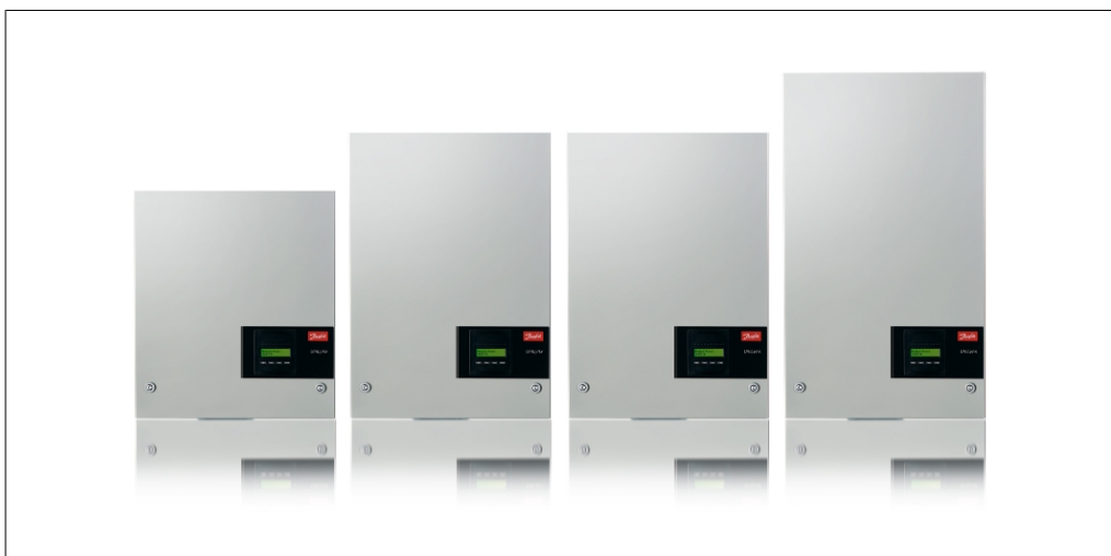
Ilustração 1.1: ULX Inversor de Exteriores com Display

Este manual descreve Danfoss inversores fotovoltaicos. Estes produtos estão entre os inversores tecnologicamente mais avançados e eficientes no mercado e foram concebidos para proporcionar energia solar ao proprietário durante muitos anos de forma fiável.